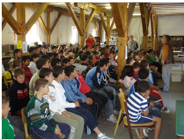
Storsamling på Löftenas Barn. Man sjunger både sånger på romani och på rumänska tillsammans med barnen. Det kristna budskapet i sångerna är tydligt.