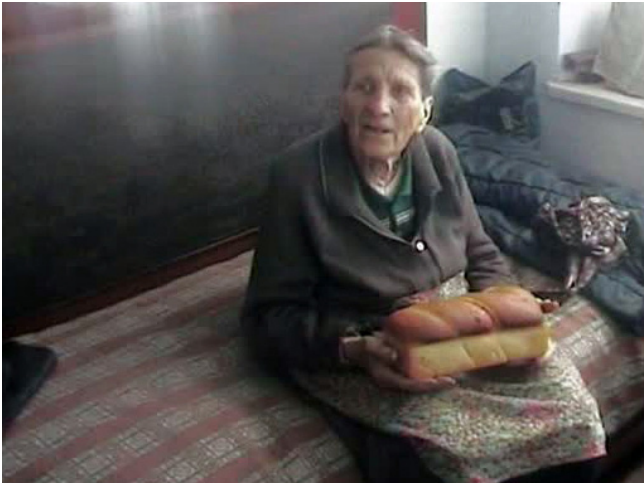
Vårt dagliga bröd. En kvinna som fått ta emot ett av de bröd som bakas i bageriet.

tillgång för församlingen där. Därför avvaktar vi något med att föra upp dem på vår talong. Men, åter igen, behoven är enorma, så din gåva, om du väljer skriva Moldavien eller Dagligt Bröd, kommer naturligtvis att gå till detta ändamål.