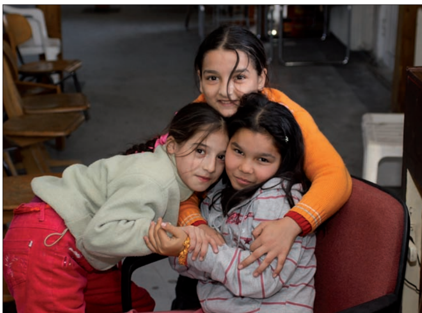
Några av de flickor som regelbundet besöker Löftenas Barn. När jag var där åkte flickorna rullskridskor för första gången.

Behovet av nya missionärer, evangelister och pastorer är enormt. I Rumänien ropar man efter nya pastorer. Bibelskolan hämtar sina elever från olika platser runt om i Rumänien. Några få kommer ända från Moldavien. Att försöka svara upp mot det behov som finns är en av de stora utmaningarna. Den kull av elever som börjat sin tre år långa utbildning inom teologi och media har en tuff utmaning framför sig. I år är medieeleverna fler än de varit tidigare. I den första årskullen är de 12 till antalet, vilket är det största antal man haft. Efter att ha följt skolan under ett antal år och därmed också fått möta en hel del elever märker man tydligt att kunskapsnivån hos eleverna är mycket låg. Få har arbetat med ljud eller media innan