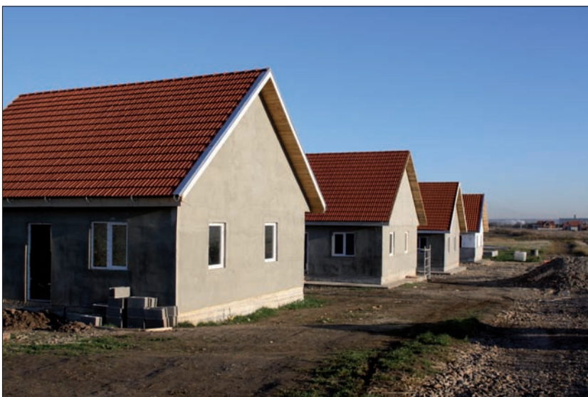
De första av många hus växer nu fram i vad som med tiden kommer bli en hel liten by av hus. Ett på många sätt viktigt steg tas nu som kommer ge många familjer och unga en ljusare framtid.

inte ihåg antalet så här i skrivande stund. Husen är avsedda för de ungdomar eller husföräldrar som inte har ekonomiska förutsättningar att på egen hand bekosta ett hus. Ungdomar som växer upp på Caminul Felix, som gifter sig och bildar familj saknar ekonomiska förutsättningar att bygga någonting eget. Liknande förutsättningar gäller också de husföräldrar som vikt större delen av sitt yrkesverksamma liv åt Rumäniens övergivna barn. Dessa makar kunde, med rumänska mått, haft ett välbetalt arbete, men istället valde man en annan väg som inneburit helt andra förutsättningar. De hus som nu byggs är också ämnade för dem. Nu kan de få ett eget hus, med allt vad det innebär. Varje hus kostar omkring 150 000 kronor att färdigställa och är i genomsnitt c:a 65-70 kvadratmeter i storlek. Inte speciellt stort men de rymmer det mest nödvändiga såsom kök, vardagsrum, badrum och ett par sovrum. För den som så önskar kan även vindsutrymmet inredas. Tanken är att de som får bo i husen också betalar en mindre månatlig summa som avbetalning. På sikt kan huset bli deras eget. Projektet kommer att pågå under flera år och utökas allt efter behov, det är inte osannolikt att även FTM-Mission kommer engagera sig genom att bekosta ett sådant hus. Säkerligen får vi anledning att återkomma till detta längre fram.