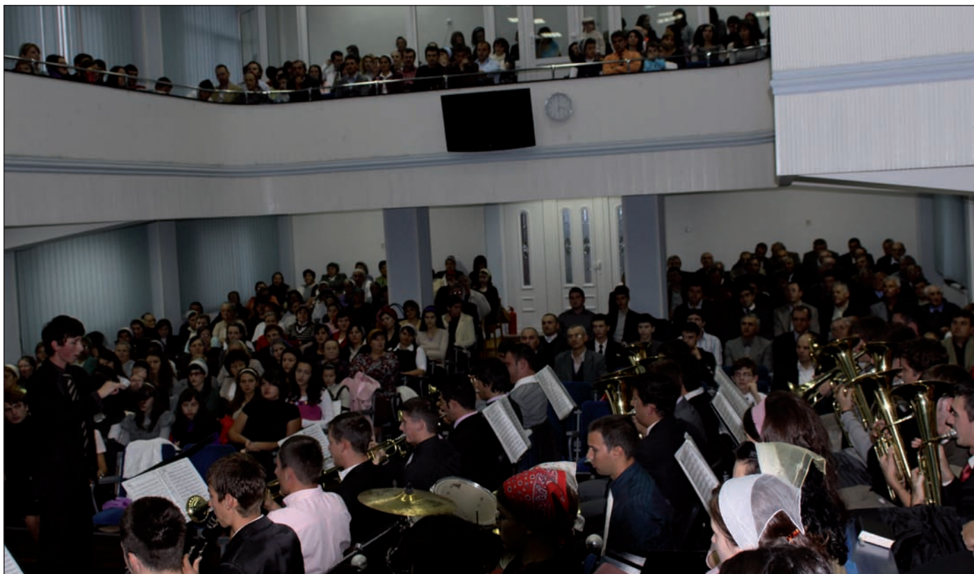
Kvällsgudstjänst i Filadelfia No1 i Oradea, en av de större församlingarna på orten. Gudstjänsterna är välbesökta och nya människor söker sig till församlingarna. Här spelar församlingens stora stolthet, blåsorkestern som är ett troget inslag vid de allra flesta gudstjänster.