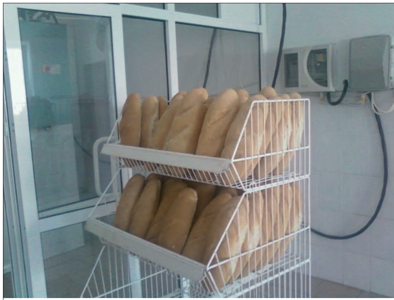
Nygräddat bröd färdigt för utdelning. I bakgrunden skymtar den nya elcentralen.