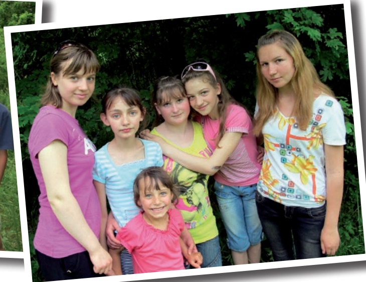
Dessa barn och ungdomar ser fram emot sommarens läger då de kommer få göra nya upplevelser tillsammans.