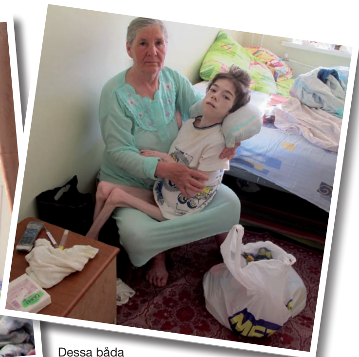
Dessa båda pojkar (bilden till vänster, den äldsta) är svårt sjuka men står i dagsläget utan möjlighet till vård.