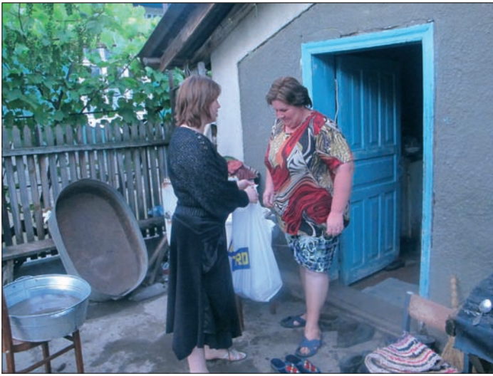
En kvinna får ta emot ett matpaket. Många vittnat om att de upplever Guds omsorg om sina liv och sin familj.

i människors liv i det som Gud gör dessa dagar. Vi har också delat ut matpaket till familjer i både juni och juli månad. Många människor bekände, då vi kom, att de var utan pengar och saknade någonting att äta de dagar som låg framför. Men nu fick de ta emot matpaket och fick se och uppleva att Gud har omsorg om dem, många grät och bekände att Gud är stor och mäktig och att han ser dem i deras nöd och i härlighet fyller deras behov. Vi tackar Gud för Guds verk i dessa människors liv.