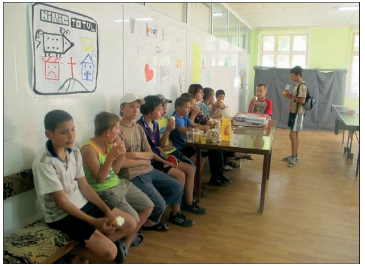
Också i församlingen ser man en förändring, många barn har deltagit i dagsaktiviteterna som ordnats innan lägret.

Med jämna mellanrum försöker jag skriva något om denna möjlighet. Med tacksamhet står vi som förmånstagare