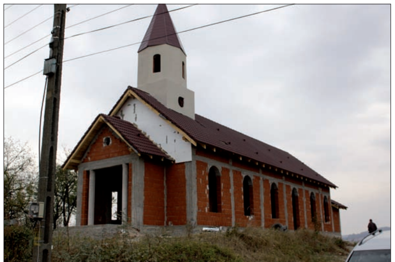
Kyrkan i Spinus har fått väggar och tak, i april fanns där bara en halvfärdig grund.

Den största händelsen i verksamheten här på Löftenas barn under den gångna perioden är den förhandling som nu sker av skötseln av ett statligt barnhem i Oradea, barnhemmet har 93 barn och unga. Avtalet är inte helt i hamn då det för närvarande också pågår politiska val inom de olika partierna och därmed vem som skall ha den beslutande makten. Att man överlåter driften till privata aktörer är någonting nytt i Rumänien varför det som nu sker är helt obekänt. Men vad som är så fantastiskt är det under som Gud lät göra