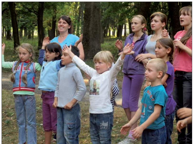
Flera av de barn som var med på sommarlägret kommer nu till församlingens olika aktiviteter för barn.

Vi har börjat baka bröd i formar, det ger mer smak och så ryms det fler åt gången. Med Guds hjälp bringar verksamheten fler själar till församlingen. Jag har sett nya, äldre personer som har besökt oss och som vill komma regelbundet till församlingen. Pratade men en ung man som vittnade att han tycker om att vara i kyrkan och allt han hör predikas där berättar han för föräldrarna hemma. Han till och med ringer till andra vänner och ber dem komma med till kyrkan. En dag gick han ut efter en kompis som var för blyg för att komma in då det var första gången han var där. Han var mycket glad att kompisens fick följa med in. Han vittnade om att han kommer att göra så även med andra av sina kompisar. En gång efter gudstjänsten kom han till talarstolen och bad mig ge honom Bibeln så att han kunde hålla den i sin hand. Efter att ha studerat den lite med sin blick lämnade han tillbaka Bibeln och sade: " - Denna bok attraherar som en magnet drar till sig järn. En dag vill jag också förstå den som du gör så att också jag kan berätta för andra om dess innehåll." Jag uppmuntrade honom att läsa i den och be till Gud så att Gud ska öppna hans sinne så att han förstår den. Han var överförtjust att få höra detta. Från den dagen är han med på alla möten i kyrkan. Och efter gudstjänsten återvänder han hem till de sina, med ansiktet strålade av glädje, berättande