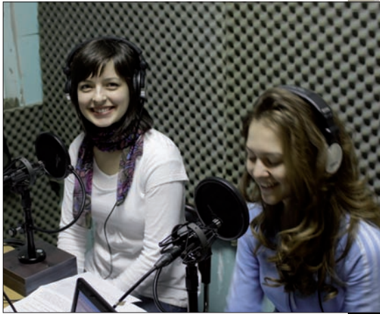
Idel glada miner. Det är roligt att producera radio, det kan dessa unga damer intyga.