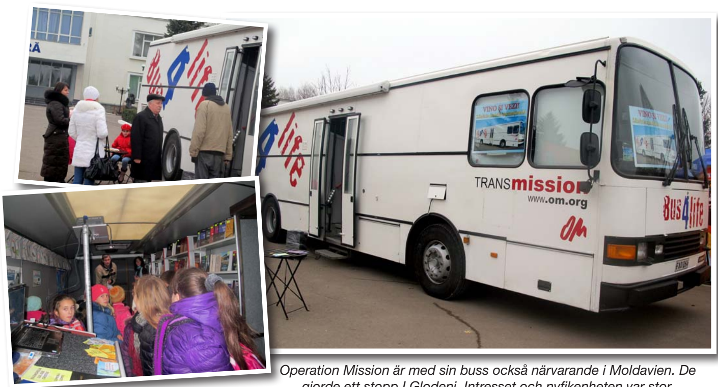
Operation Mission är med sin buss också närvarande i Moldavien. De gjorde ett stopp i Glodeni. Intresset och nyfikenheten var stor.

Det har gått en tid sedan mitt senaste brev. Det känns som om tiden bara flyger iväg. Mycket händer runt omkring oss och vi ställs inför fler och fler utmaningar. Men Herren är god och trofast och vi försöker vara trofasta emot Honom och den kallelse Han gett oss.