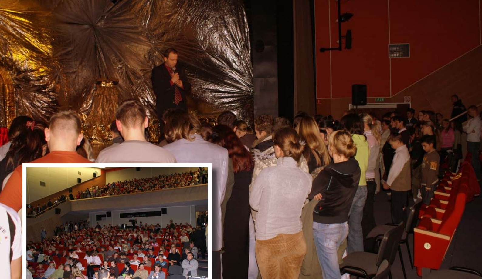
Människor i stora skaror söker sig fram för att ta emot frälsningen. Detta drama har visats för 15000 människor i Polen under 2011.