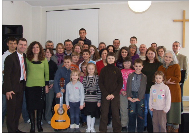
Medlemmar i församlingen i Klodsko, Polen. Klodsko ligger i sydöstra delen av Polen.

perspektiv vi har på detta livet och vilket löfte Bibeln ställer fram; det eviga perspektivet. I stunder som dessa får vi påminna varandra om Johannes ord från Uppenbarelsebokens 21:a kapitel: "Och jag hörde ett kraftigt rop från tronen: 'Se, nu har Gud sitt hem bland människorna! Han skall bo tillsammans med dem, och de skall vara hans folk, ja, Gud själv skall vara bland dem. Han skall torka bort alla tårar från deras ögon och det skall inte längre finnas någon död eller sorg eller gråt eller plåga. Allt detta är borta för evigt'". (HFL) Ord som andas hopp och tröst.