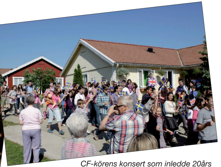
CF-körens konsert som inledde 20års firandet. Samt lördagens festligheter i barnby nr 1, Sanmartin.

Det är med stor ödmjukhet och med stor tacksamhet vi som arbetar här kan blicka tillbaka och se att Gud varit trofast FTM-Mission i arbetet genom åren. Samtidigt måste vi vara medvetna om att det, trots att det har gått tjugo år, fortfarande finns barn som lider och har det svårt. Därför fortsätter vi arbetet för dessa barn genom att vara en resurs för arbetet.