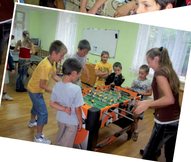
Sommarlägret blev även i år en betydelsefull insats, framför allt för barnen, men det knöts också många nya kontakter med föräldrar och med några helt nya familjer.