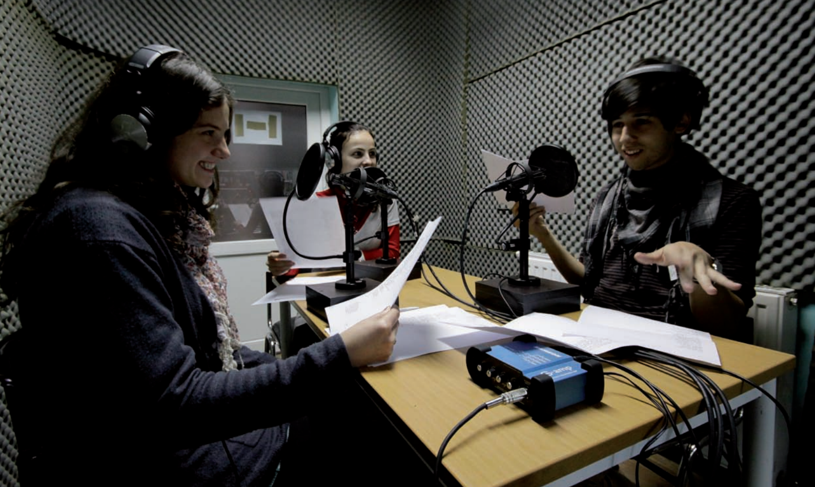
Eleverna från årskurs 1 i studion i full färd med att spela in årets juldrama.

Önskar du stödja denna satsning ber vi er att kryssa i på talongen eller skriva "Matpaket till Jul" på ärenderaden då du ger din gåva via din bank. Vi tackar på förhand för din villighet att ge dessa människor en lite ljusare och varmare jul.