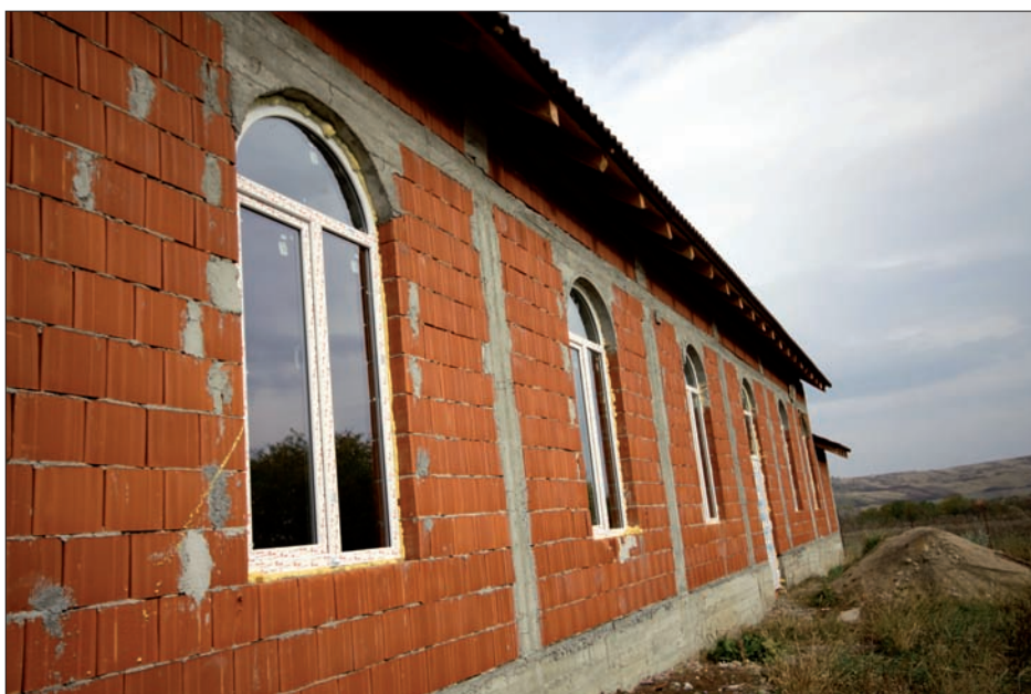
Nu är fönster och dörrar monterade och nu väntar arbete inne i lokalen. Först kommer el att kopplas in därefter vatten övrig installation.

Det är glädjande att se hur arbetet växer i församlingen. Tack vare brödet och matpaketen finner allt fler människor, framför allt barnfamiljer, en ingång i församlingen. Men den helt avgörande insatsen för den utveckling vi nu ser har varit de två sommarlägren. Dessa båda läger har inneburit att många nya kontakter skapats. Helt nyligen startade man den efterskolan aktivitet i församlingen för att bättre kunna stödja dessa "sommarlägerbarn" och ge dem en naturlig väg in i Guds rike. Samtidigt som man gör detta når man hela familjen. Denna satsning i kombination med bröd och matpaket förändrar inte bara människors livsvillkor, den får en graverande effekt på samhället i stort.