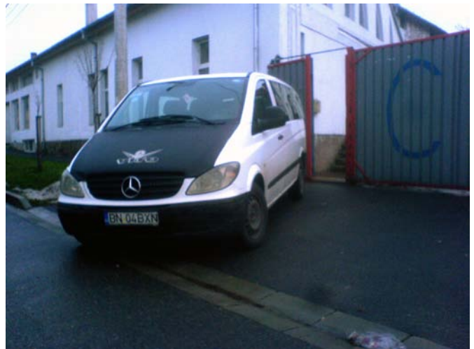
Den nya bussen utanför Löftenas Barn. Bussen fyller en viktig roll i barnens skogång, då den bl.a. gör så att barnen kommer till och från skolan.