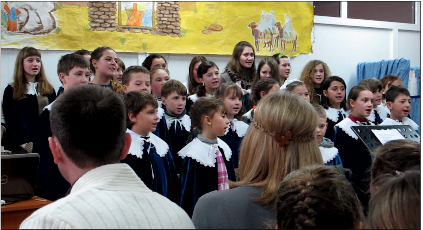
Vilken fantastisk glädje! Dessa barn och ungdomar kommer nästan uteslutande från familjer som inte tidigare haft någon kontakt med församlingen. Väckelsen har kommit till denna församling.

om en dopförrättning. En försmak av vad Gud har tänkt. Redan idag känner vi flera som står på tur att döpas, men som av praktiska skäl inte kunde döpas i sommar. Detta är vi tacksamma till Gud för. Vi känner också tacksamhet till er som troget stödjer arbetet på olika sätt. När vi närmar oss våren planerar vi för att göra ännu en resa till Moldavien. Det känns viktigt att följa arbetet på plats för att bättre kunna avgöra hur vi bäst kan stödja församlingen i deras arbete. Makarna behöver allt stöd de kan få både praktiskt men också genom förbön.