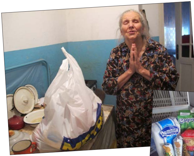
Några av mot- tagarna som fått ett matpaket till jul. I paketen fanns också korg och en del frukt.