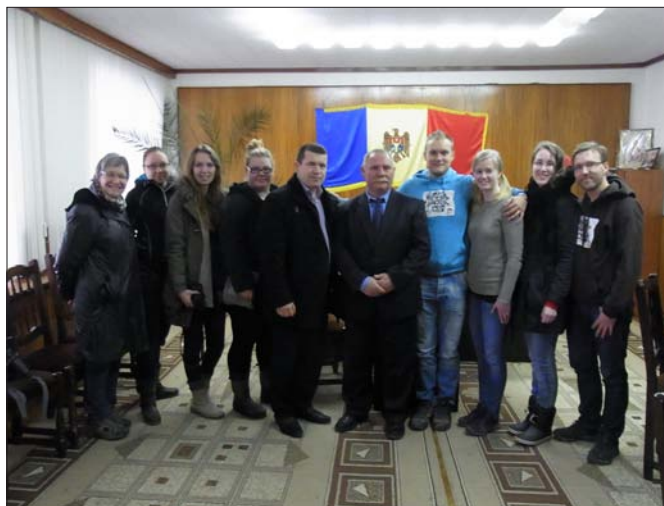
Den grupp av finska bibelskoleelever som fick bedja för landshövdingen och de som arbetar där.

Idag kommer barn i alla åldrar till församlingens dagverksamhet. Grunden för detta lades i samband med de två sommarläger FTM-Mission bekostat.