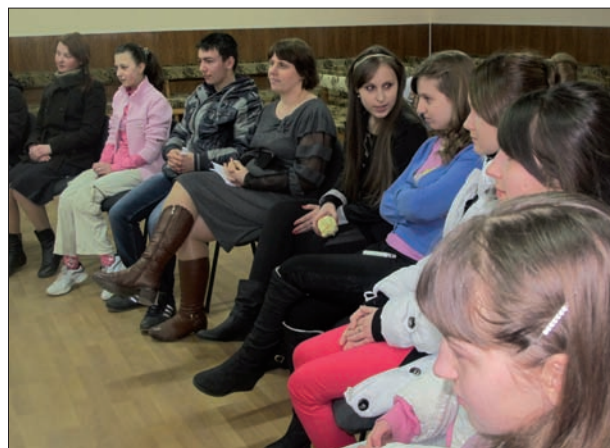
Samling för ungdomar som nyligen startats.

I Bibeln står det skrivet: " Lyft blicken och se dig omkring! Alla samlas och kommer till dig. Dina söner kommer från fjärran, dina döttrar bär man i famnen. När du ser det skall du stråla av lycka, ditt hjärta skall bäva och bulta, när havets skatter kommer i din ägo och folkens rikedomar blir dina. " (Jes 60:4-5). Gud ser de saker som nu händer i staden Glodeni. Personligen har jag inga ord för att beskriva min förvåning och jag ryser vid tanken på