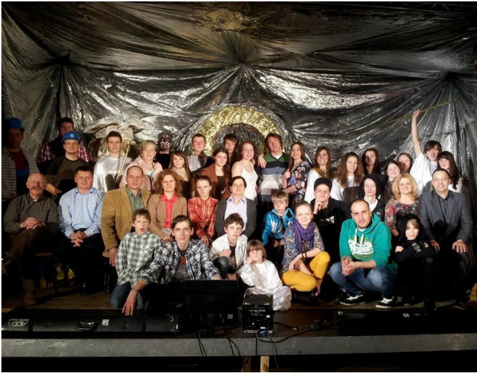
Det är tillsammans med de lokala församlingarna som dessa dramor arrangeras.

församlingen på orten. Sedan dess har vi besökt fem Lutherska församlingar. Vi var först lite tveksamma till dessa förfrågningar. Vi bad över det och kände då att om församlingarna utan förbehåll sa "ja" till hela paketet; alltså frälsningsinbjudan, tid för personlig förbön etc. var det också meningen att vi skulle acceptera deras önskan. Vi såg detta som en öppen dörr som Gud givit till oss. Det är viktigt att också känna till att detta är ett mycket speciellt område i Polen, där det finns fler Lutheraner än det finns katoliker, och då skall man också känna till att i Polen är 95% av befolkningen katoliker. Det var ifrån ett sådant område inbjudan kom. Dessa Lutheraner kommer från den Pietistiska rörelsen inom den Lutherska kyrkan, som härrör från 1800-talet fram till mitten på 1900-talet och senare. Den har i allmänna ordalag haft inflytande på Protestantismen och Anabaptismen som bland annat gav inspiration åt John Wesley som grundade den Metodistiska traditionen.