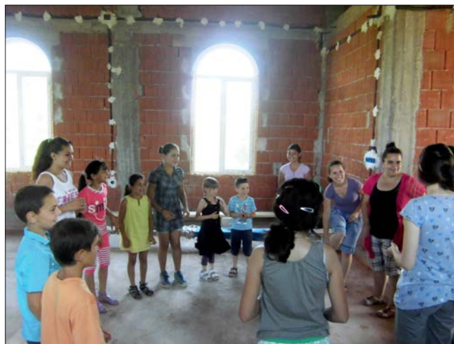
Sommarens evangelisation ger fler möjligheter till att samlas i den ännu ofärdiga lokalen. I bakgrunden syns de dragna elledningarna.

Vi har nu nått avslutningen av detta nyhetsbrev. Tack för att du tog dig tid att läsa det. Tack också för ditt engagemang för de människor som kommer i kontakt med oss som mission i de länder vi når ut till. Nu väntar en tid för oss här på missionen med mycket praktiskt arbete. Vi står nu i begrepp att påbörja det praktiska arbetet med att flytta till våra nya lokaler. Från mitten av augusti kommer vi att intensifiera arbetet med flytten. Det kan därför vara svårare att nå oss ibland. Flytt av telefon och data medför att vi inte kan nås så lätt. Vi hoppas det finns förståelse för detta. Vi hoppas och tror att vi skall vara på plats i våra nya lokaler till den första oktober. På återhörande om en månad.