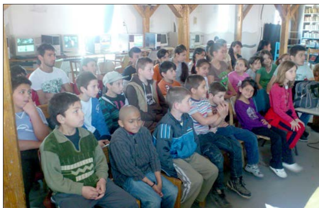
Sång och musik utgör ett viktigt inslag i arbetet. Här övar man kristna sånger inför en kommande konsert.