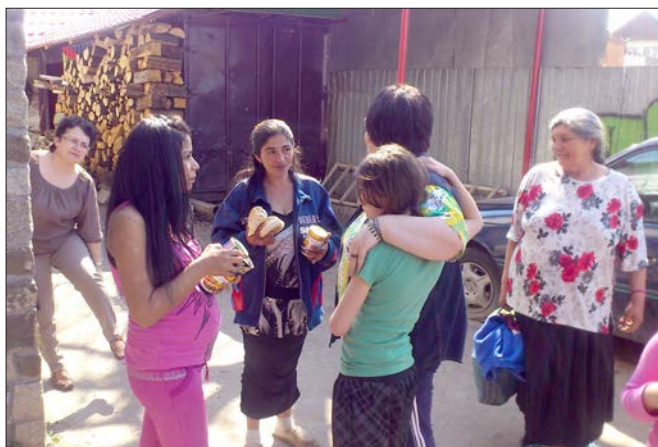
Varje torsdag har man utdelning av matransoner. Flickan till vänster i bilden är 19 år och är gravid, fadern är okänd.