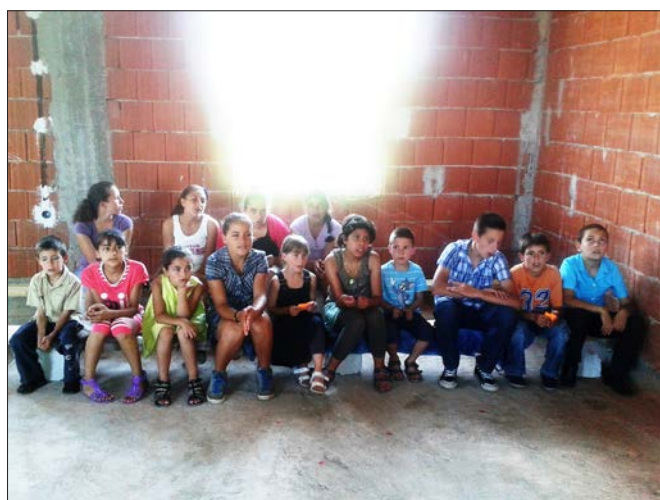
När lokalen är färdig hoppas man kunna starta en söndagsskola.