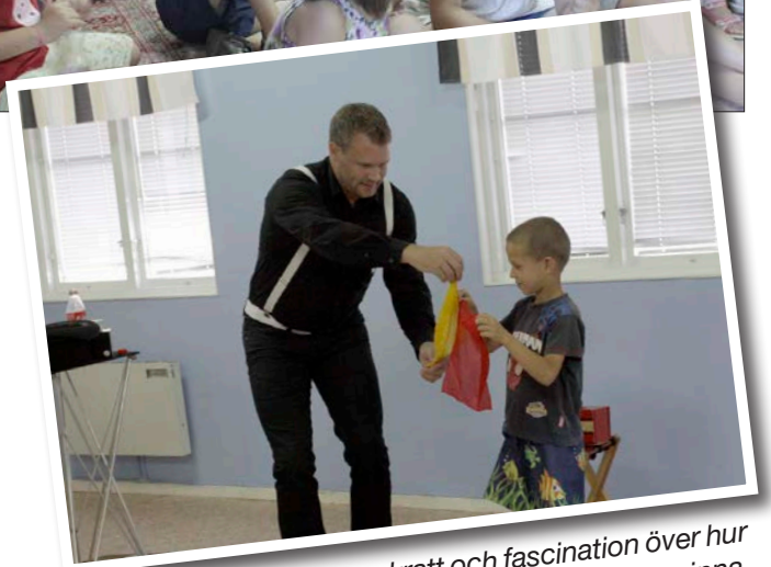
Caminul Felix. Glädje, skratt och fascination över hur saker kan byta färg, plats eller helt enkelt försvinna.

på vilket han fick saker att "försvinna", ändra färg och byta plats, bidrog till mycket skratt och stor förvåning.