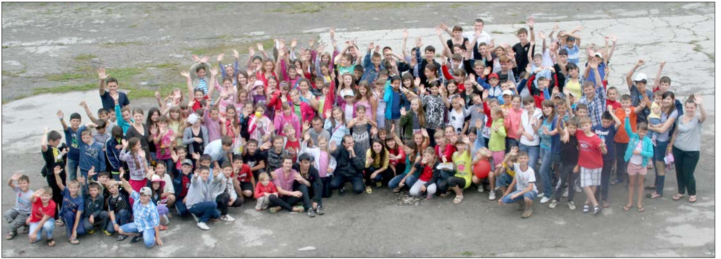
Alla 60 deltagarna samlade. En vecka med bibelundervisning, bön och gemenskap, men också mycket roligt är till ända. Många ser redan nu fram emot nästa års läger. Alla säger ett tack till dig som gjorde detta möjligt.

vi Gud välsigna maten, men vi ber också under dagen. Detta förändrade beteende har gjort våra föräldrar nyfikna och de frågar varför vi gör detta. De är överväldigade av den förändring som skett i våra liv. Vi svarar att det är Gud som gör denna skillnad, vi har fått lära känna Honom och hans Son Jesus Kristus.