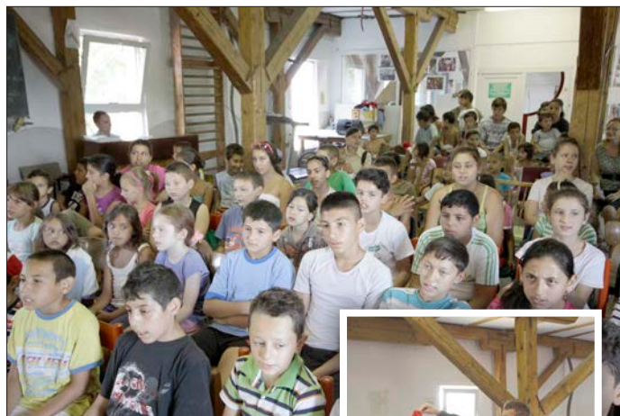
Möjlighet att få uppleva detta "live" var någonting helt nytt för barnen på Löftenas Barn.