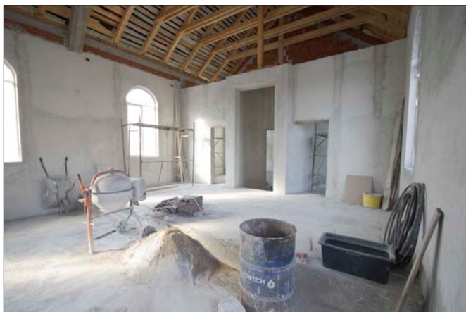
Det är mycket glädjande att man nu börjar se resultat även invändigt. Här är första lagret puts på plats. Ett ännu finare väntar. Därefter innertak och golv.