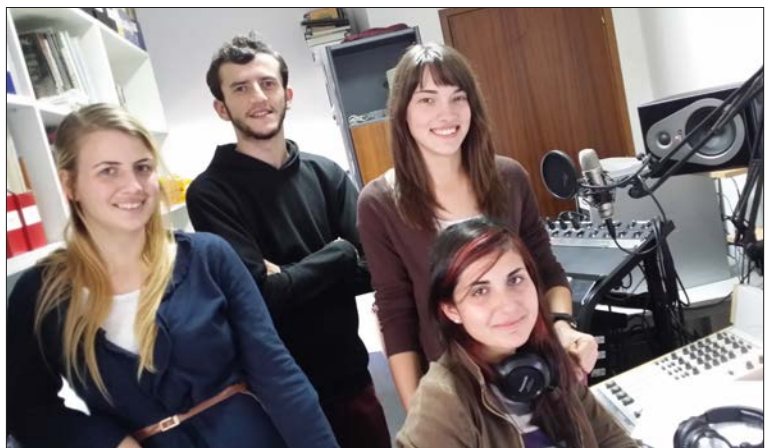
Fyra av fem elever på plats i studion för att lära sig om radio.

Det är oerhört spännande att få möta eleverna på Bibelskolan, inte minst nya bekantskaper som precis börjat studera. I år hade vi fem stycken elever, fyra tjejer och en kille. En mindre grupp än tidigare, men dessa elever var både intresserade och motiverade. Vad man åter igen kan konstatera är att kunskapsnivån inom det område vi undervisar är ganska låg, varför man först måste arbeta sig upp till "noll" och därifrån bygga vidare. Det blev fem intressanta dagar med mycket ny kunskap för eleverna att ta in. Vi är medvetna om att kursen är intensiv med mycket information och ny kunskap. Nu är vår förhopp-