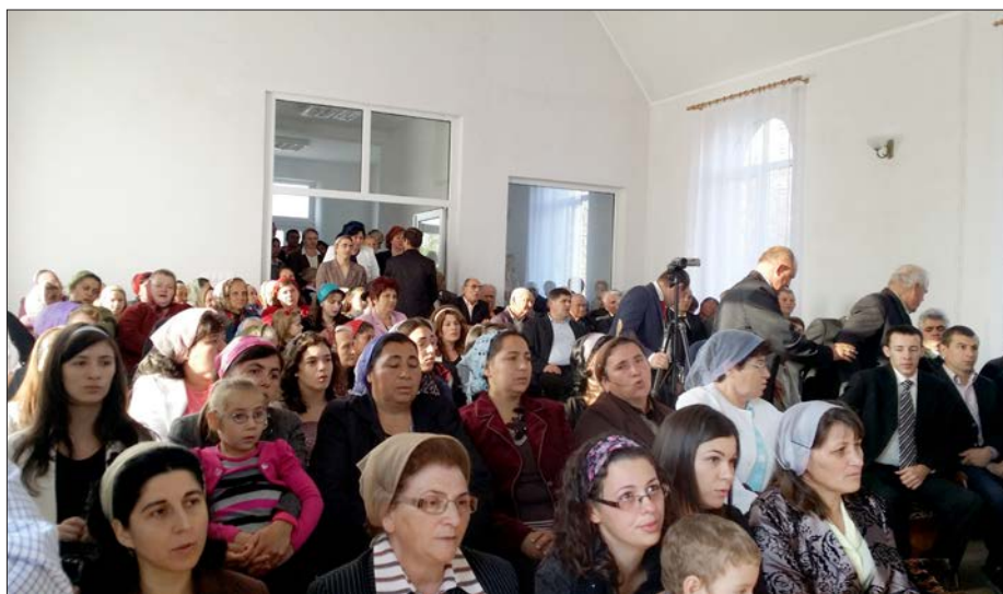
Kyrkan fylldes snabbt till bredden av människor som ville vara med. Det var fullt ända ut i hallen.