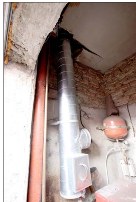
Den nya skorstenen är nu på plats.

med pengar till ett sammanlagt värde av 72 248 kronor. Vid sidan av detta tillkommer också värdet av den ljudanläggning som vi fått sponsrad av Art-Elektronik. Åter igen ett stort tack för det ni bidragit med! Detta ger vid handen att det sammanlagda värdet som missionen bidragit med uppgår till ca 115 000 kronor.