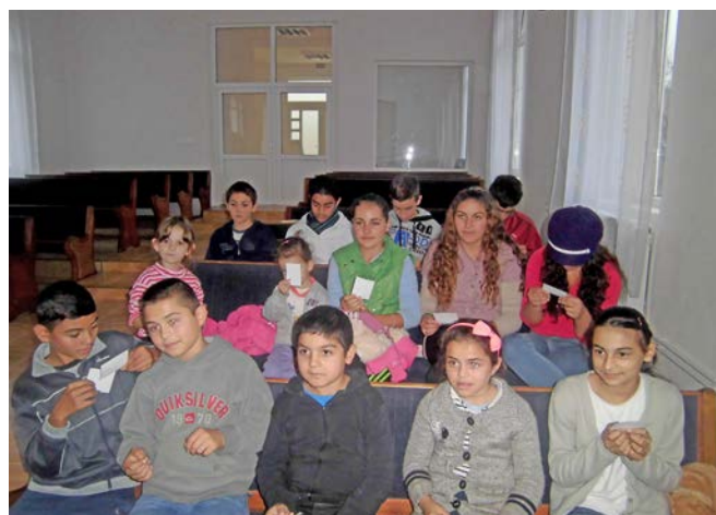
Barn och ungdomar som kommer till aktiviteterna i kyrkan.

När det gäller dessa barnaktiviteter finns det en önskan ifrån oss, att vi skall kunna göra mer. Om församlingen kunde ges ett månatligt stöd skulle