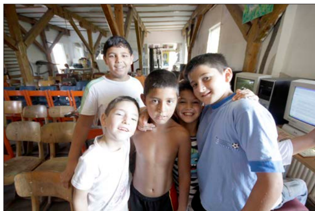
Några av de barn som kommer till Löftenas Barn.

Vi har nu avslutat arbetet med att lyfta dit den nya skorstenen, du såg den då du besökte oss. Tack vare er generösa gåva till Löftenas Barn har vi också kunnat köpa kol och ved till vintern. Vi har anställt en ny socialassistent. Hon kommer arbeta med uppsökande verksamhet för att kunna utöka vår påverkan på de familjer som skickar sina barn till oss. Behoven är så enorma att vi inte vet var vi skall börja hjälpa dem. De flesta är analfabeter, saknar identitetshandlingar och kan därför inte söka arbete. Utan identitetshandlingar kan de inte få någon hjälp från staten. Många lever i social misär med bristande hygien, många har också en lösaktig moral. När jag ser all denna tragedi som orsakats av ett liv i synd genom generationer, gör det ont mitt hjärta. Detta liv är ett helvete utan Gud. Vi tackar Gud för hans vägledning i detta arbete. Vi tackar honom för alla de resurser han sänder