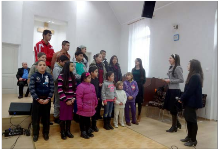
Det är glädjande att se barnen som finns med i församlingens arbete. De allra flesta kommer från familjer som ännu inte tillhör församlingen.