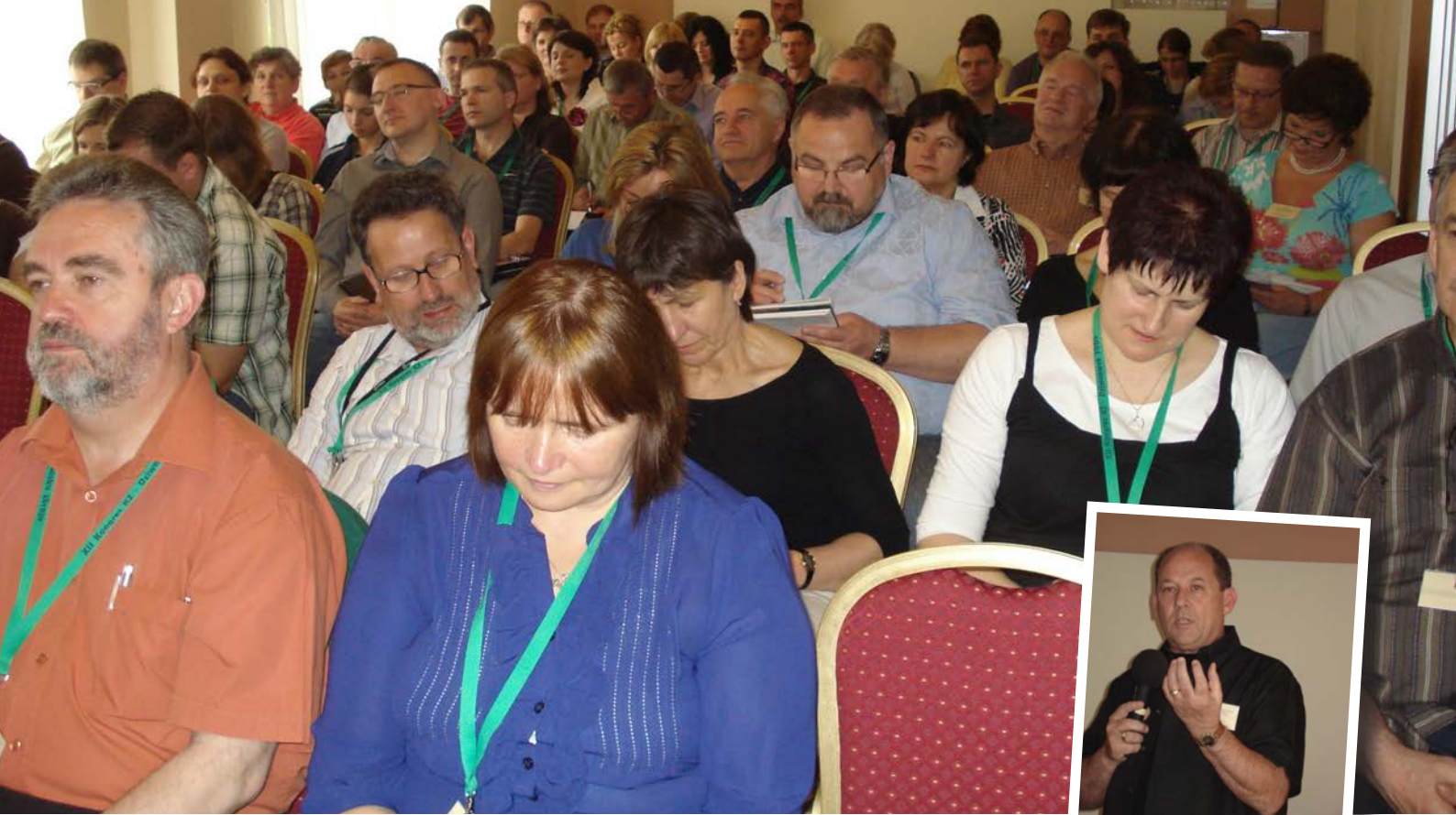
Pastorer och fruar samlade till undervisning i Kudowa 2010. Vi planerar att hålla nästa konferens på samma plats. Det finns redan nu förväntningar inför konferensen.

Jag känner en oerhörd tacksamhet för den kontakt vi genom åren haft med FTM-Mission och indirekt de som stöder detta arbete. Vid förra konferensen stod denna organisation för 80 % av kostnaden det innebar att genomföra konferensen. Undervisningen var förstklassig med flera goda talare som undervisade utifrån egen erfarenhet. Nu fick de pastorer som deltog uppleva det som jag själv fått uppleva för 30 år sedan. Då jag besöker olika församlingar får jag än idag berättat för mig vad den konferens som genomfördes 2010 betytt för dem.