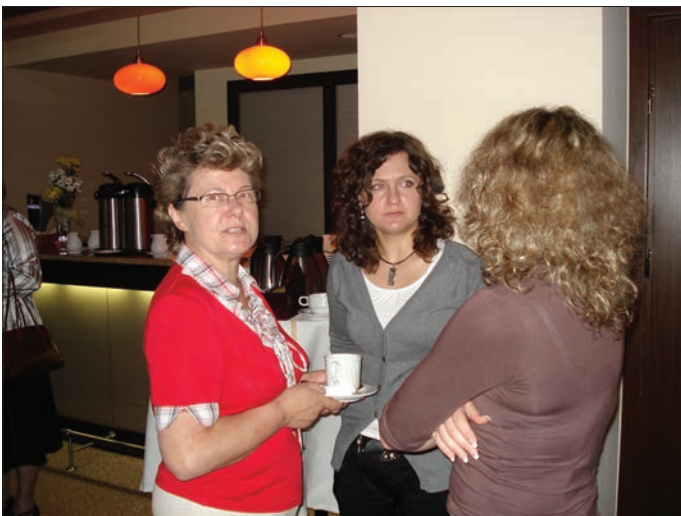
Några pastorsfruar samtalar under en av pauserna på konferensen. De informella samtalen är också viktiga.

för ditt stöd i detta projekt. Beroende på antalet deltagare räknar vi med att konferensen kommer kosta mellan 80-100 000 kronor att genomföra. Vi riktar redan nu ett tack för din insats.