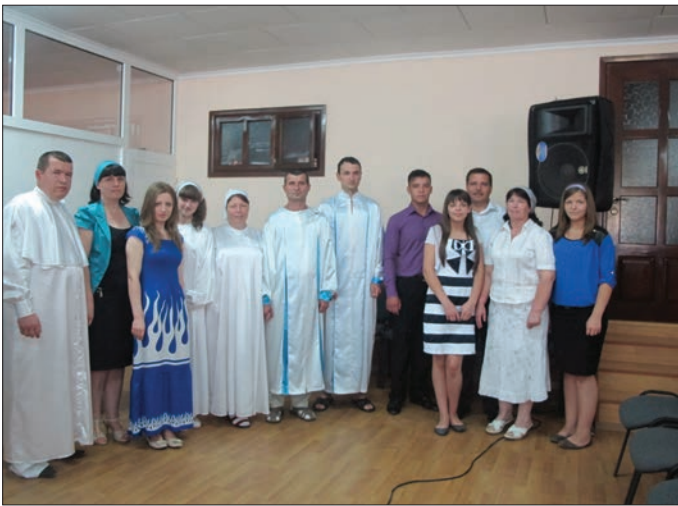
Fyra av de fem dopkandidaterna uppställda för fotografering. Till höger står en tillrest pastorsfamilj.