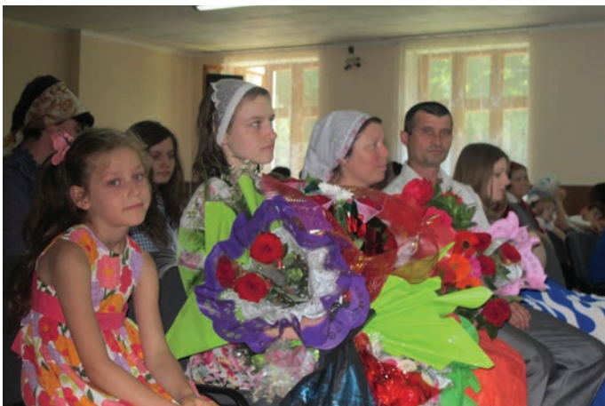
Blommor delas ut efter dopförrättningen.