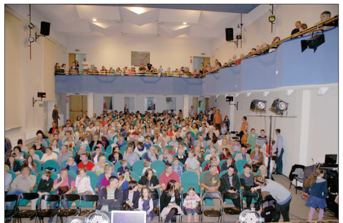
Nästan fullsatt. Många människor nås av evangelium genom detta drama.

Vi höll våra repetitioner i församlingshemmet intill den katolska kyrkan där vi skulle spela upp dramat. Samtliga skådespelare kom från katolska församlingar i området. Alla var mycket glada och entusiastiska att få medverka i dramat. Senare berättade flera av dem att deras troende vänner inte velat medverka, eftersom de hört att vi kom från en evangelisk församling och ogillade detta. Under dessa dagar bad vi mycket tillsammans med dessa vänner. Vi fick många möjligheter