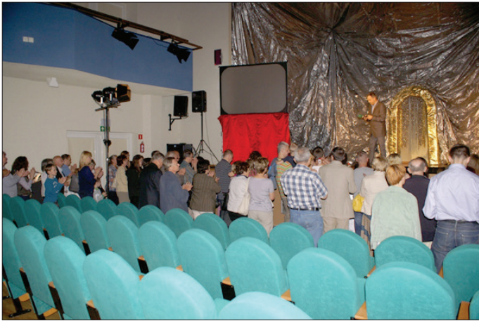
Många människor hörsammade inbjudan till frälsning.

till samtal. Vid flera tillfällen spenderade vi flera timmar i församlingshemmet kök, där vi fick dela vår tro och svara på många frågor.