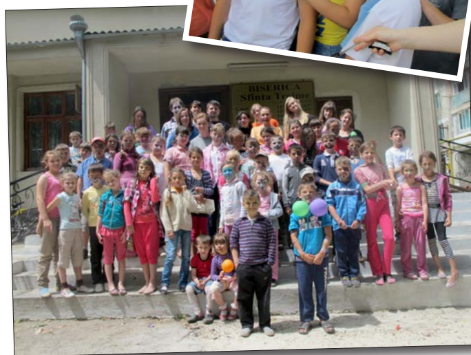
Barn som deltagit på sommarens läger. För många av barnen är detta sommarens höjdpunkt.

förbereda dem för livet och ge dem en framtid och ett hopp. Prisad vare Gud!