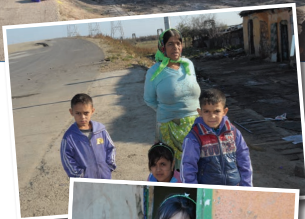
Den romska mormodern med sina tre barnbarn som tvingas flytta.