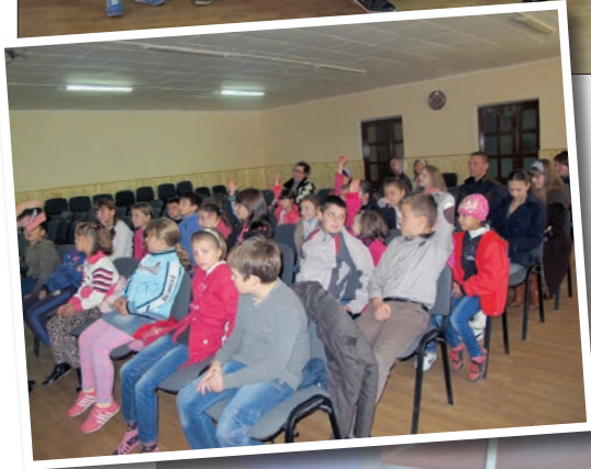
Många glada och tacksamma barn kommer till "Klubb Hopp".