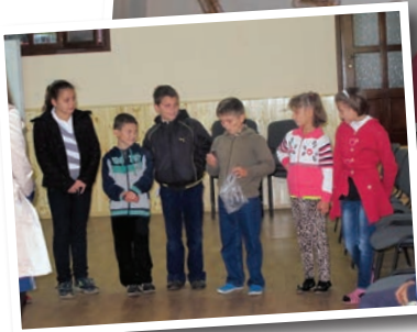
Bibelberättelser, tävlingar och pyssel är några av aktiviteterna