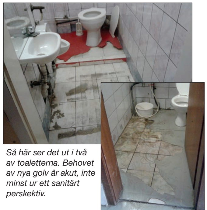
Så här ser det ut i två av toaletterna. Behovet av nya golv är akut, inte minst ur ett sanitärt perspektiv.

Det känns angeläget att Löftenas Barn kan fortsätta sin verksamhet. För de flesta av de barn som besöker centrat är den hjälp de får den enda hjälp som erbjuds dem. Speciellt de som inte regelbundet går i skolan. Det