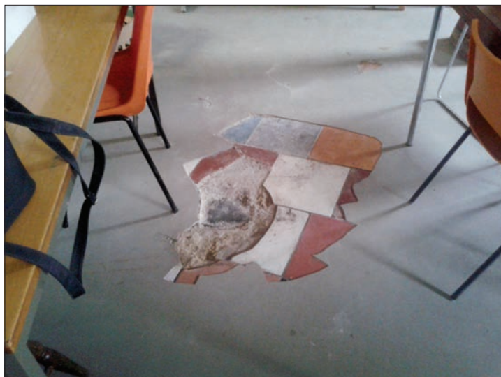
Bilden är tagen i en av samlingssalarna där barnen gör sina läxor. Lokalen ligger vägg i vägg med köket.