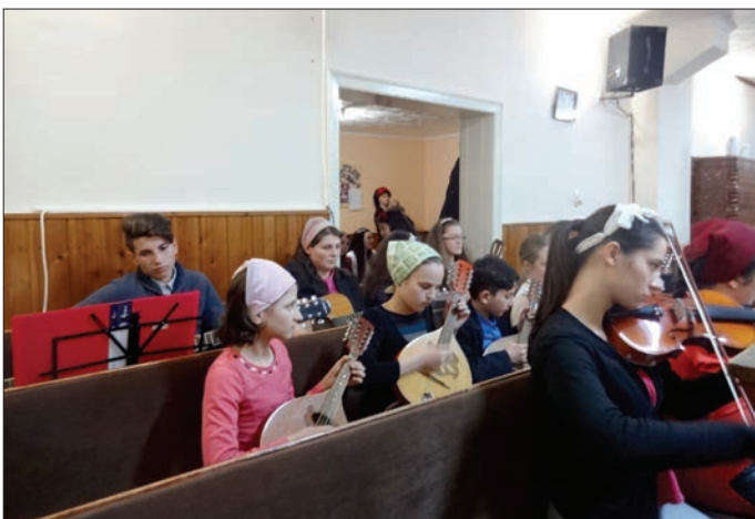
Evangelisationskampanj i församlingen i Tinca. Många nya människor kom för att lyssna till evangeliet.

När vi vågar samtala om det som plågar oss, skall vi snart märka att våra perspektiv kommer förskjutats. Det är inte genom att avstå från att berätta eller blunda för våra problem som de försvinner. Snarare är det så att de kommer nöta ner oss och förminska oss som människa. Det blir istället vi som försvinner, inte vårt problem! Att få säga att det inte känns bra, gör att det faktiskt känns lite bättre. När vi inte längre förringar oss själva, utan vågar närma oss det som smärta, kommer vi växa, inte det som plågar oss. Håri ligger själva perspektivförskjutningen. Alternativt kan vi rikta vår kraft till någon som behöver vår hjälp. Håri ligger en av livets paradoxer; den som hjälper en annan människa hjälper samtidigt sig själv. När vi vågar närma oss någon annans smärta, kommer vår egen inte få samma plats och betydelse. Här spelar det goda samtalet en oerhörd roll och är en tillgång vi inte skall förringa. Det kan vara sunt och riktigt att, för ett ögonblick, fundera över varför vi känner som vi gör och vad kan vi göra för att förändra vår situation. Bibeln är en bok för hela livet. Däri finner vi svar på allt som berör detta livet. Bibeln är en rik källa att ösa ur då vi brottas med det som gör livet svårt att leva. Att övervinna oro och rädsla handlar också om mod. Mod att våga göra något åt saken! Kanske kan man säga så här: "Mod är att göra det vi är rädda för, tills vi inte längre är rädda".