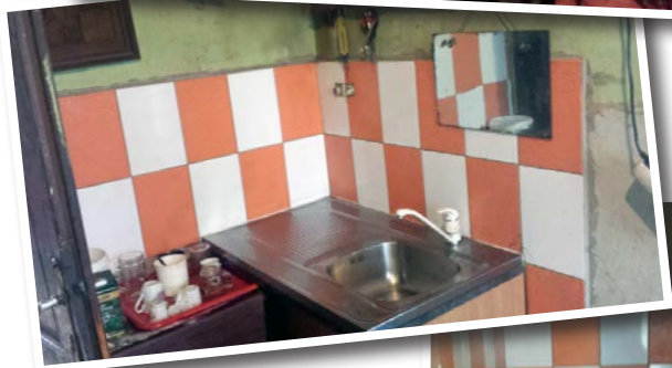
En enklare och värdigare tillvaro har vi kunnat ge den här romska familjen.