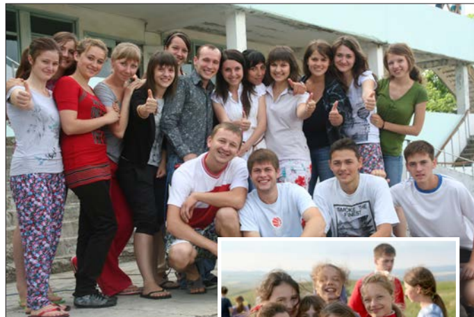
Sommarlägret är för alla åldrar och är sommarens höjdpunkt.

För oss är det en stor förmån att få stå som mottagare vid en testamentskrivning eller annan typ av donation. Välkommen att höra av dig om du har funderingar omkring dessa frågor.