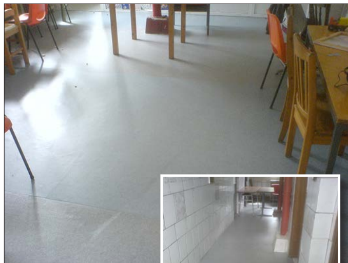
De nya fräscha golven är nu på plats.