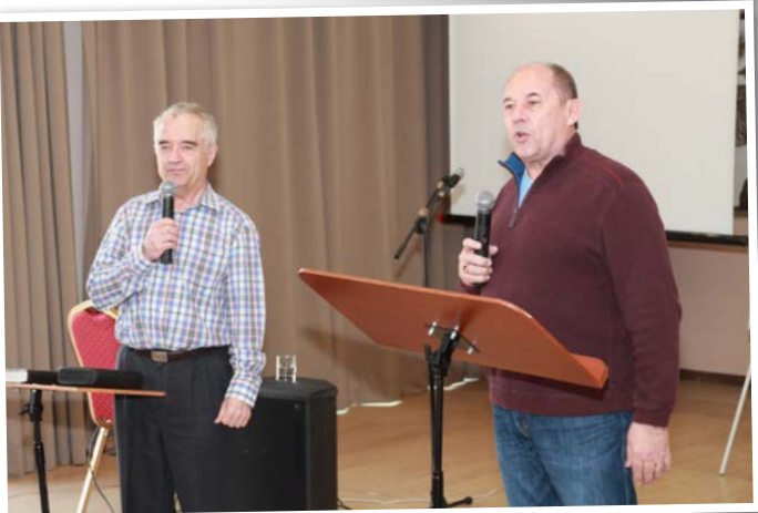
Det blev en mycket lyckad konferens! Undervisning, gemenskap och en för många behövlig vila från den vardagliga rutinen uppskattas av deltagarna.