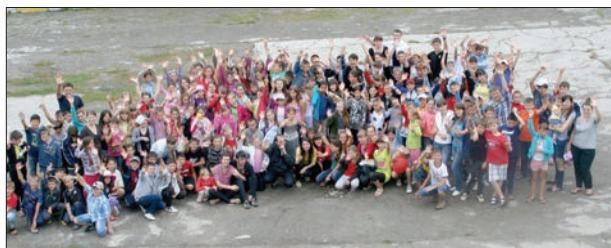
Förra årets deltagare på sommarlägret.