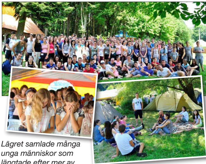
Lägret samlade många unga människor som längtade efter mer av Gud.

som fungerar. Församlingarna jag tjänar ligger 9 mil ifrån varandra. Jag tjänar i den ena på söndagsmorgonen och behöver åka till den andra för att medverka i eftermiddagsgudstjänsten. Det innebär många mil på rumänska vägar.