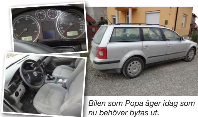
Bilen som Popa äger idag som nu behöver bytas ut.