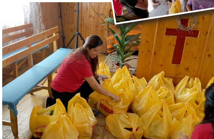
Hela gruppen samlad på Caminul Felix 2. Utdelning av matpaket i Tinca. Vi utgick från kyrkolokalen.