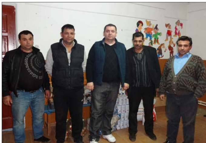
Äldstebröderna i församlingen i Tinca sänder sitt varmas- te tack för den hjälp de fick ta emot innan jul.

För första gången på många år har vi haft möjlighet att hålla en evangelisk kampanj i Hidisel de Sus. Den pågick torsdag till söndag andra veckan i december. Vi bjöd in predikanter, sångare och förkunnare från flera olika platser i Rumänien. Vi bjöd också in människor som inte var kyrkvana att komma till gudstjänsterna. Människor som vi kommit i kontakt med tidigare under hösten då vi haft begravingar. Dessa möten kom att bli till stor uppmuntran för