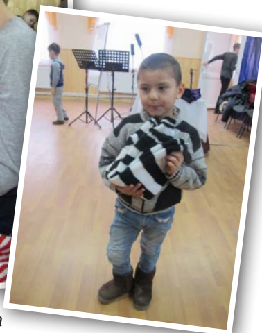
Några glada barn som fått ta emot en tröja.

arbetar i flera församlingar, med små möjligheter att ge en lagstadgad lön. Men tack vare den ekonomiska hjälp de får genom oss, kan de lägga mer tid på sin pastorstjänst, utan att behöva arbeta med andra saker för att försörja sin familj.