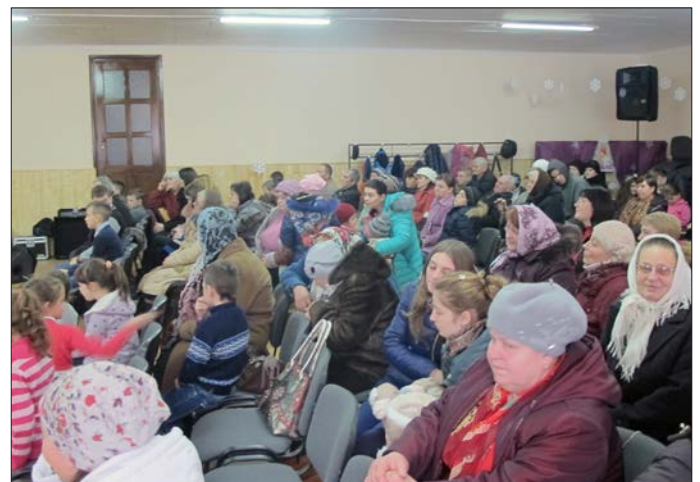
Fullsatt i möteslokalen. Många hade hörsammat inbjudan.

Den 29 december 2015 kommer leva kvar som ett vittnesbörd om Jesu födelse för människorna här. Dagens gudstjänst hade annonserats genom den lokala TV-kanalen, varje dag, under en hel vecka. Människor bjöds in till församlingen under hela denna