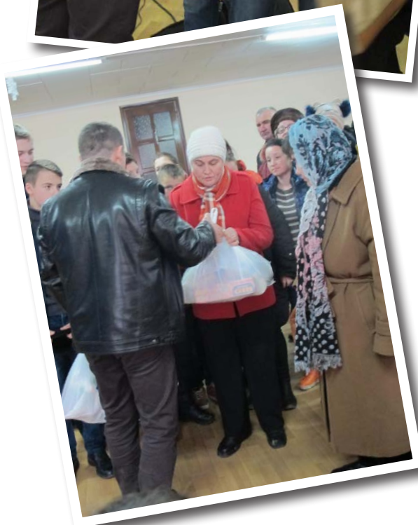
Ett axplock av de bilder vi fått ta emot från julfirande och matpaketsutdelning.