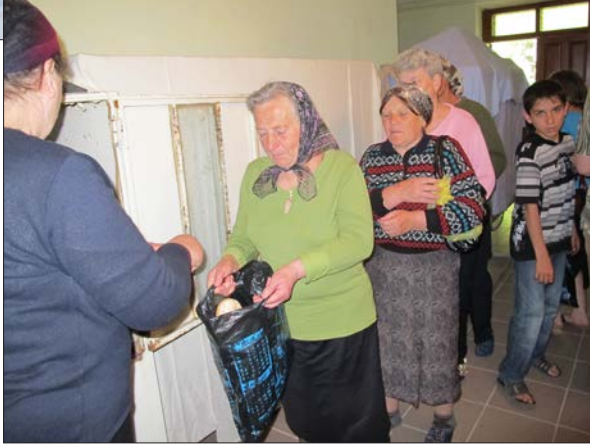
Människor väntar på att få sitt bröd.

Bageriet förser ca 100 hushåll med dagligt bröd. Varje månad bakas 2 500 limpor som delas ut gratis.