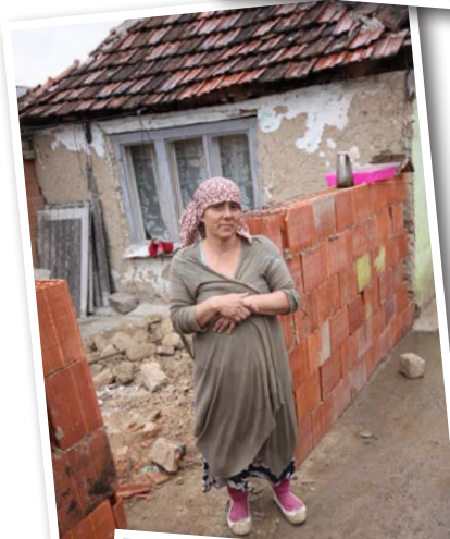
Bilderna gör knappast rättvisa åt hur det ser ut på platsen, men ger ändå en liten inblick i romernas svåra situation.