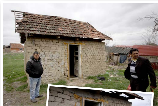
Mannen till vänster, som är svårt sjuk, bor i detta enkla skjul.

I väntan på att detta skall bli utrett, finns det behov av att hjälpa församlingen med deras önskan att göra någonting för alla de barn som finns i området. Vi för i skrivande stund samtal med församlingen om att even-