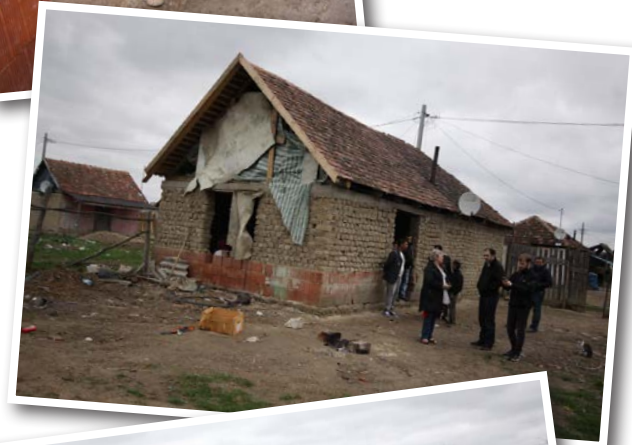
Många av husen är i mycket dåligt skick.