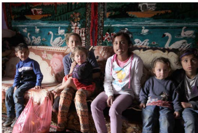
I kolonin finns det många barn. Det genomsnittliga antalet barn per familj är sju.