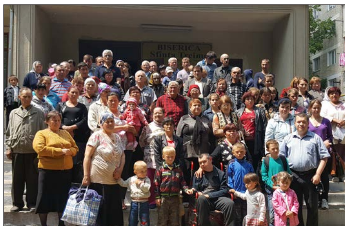
Hela gruppen som får del av matpaketet som kom till gudstjänsten. Glädjen var stor över att så många faktiskt kom.