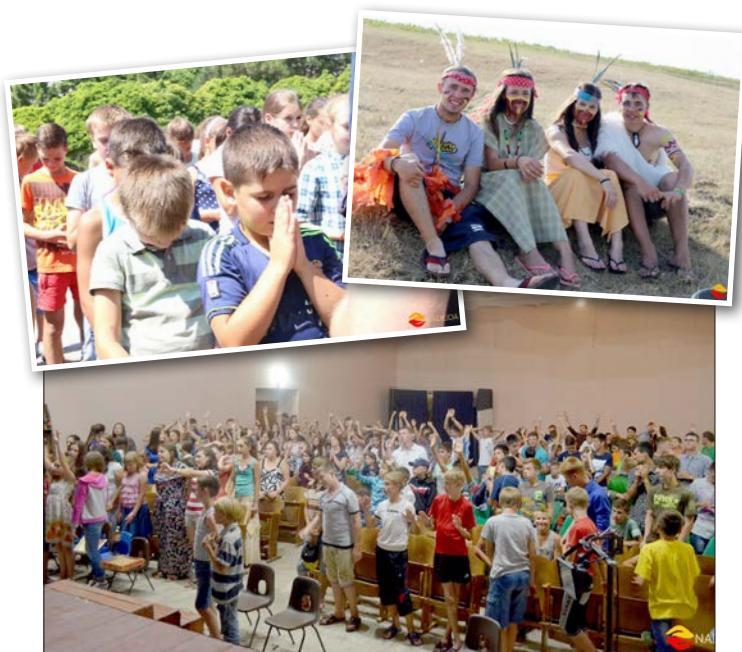
Några bilder ifrån förra sommarens läger.