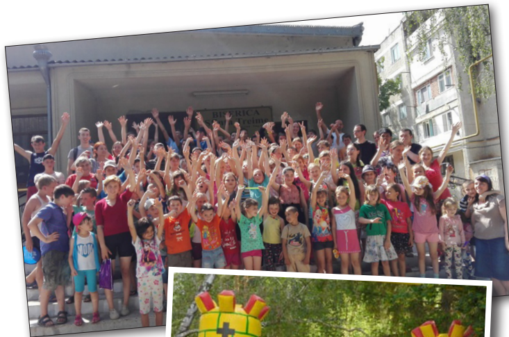
Alla hälsa och tackar!