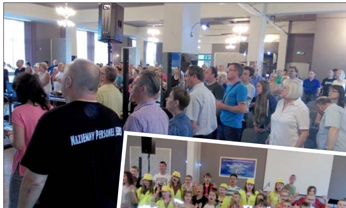
Årets sommar-konferens samlar deltagare i alla åldrar från hela Polen.

Genom Guds nåd har vi kunnat organisera ännu ett läger för barn och unga. Detta skedde mellan den 19-24 augusti här i församlingen. Vi hade omkring 90 barn i olika åldrar. Varje dag hade vi bibeltimme, bön och olika aktiviteter för barn. Varje morgon kom föräldrar och mor- och farföräldrar till kyrkan med sina barn. Alla som deltog fick ett mål mat på en restaurang som heter Mango. Den sista dagen inbjöds barnen att ta emot Jesus till frälsning. Till min stora förvåning lämnade nästan alla barnen sina platser och kom fram för bön om synderna förlåtelse. När jag frågade dem varför de kommit fram, sa de: "För att vi vill att Jesus skall förlåta våra synder." Samtliga föräldrar var glada och tacksamma över att deras barn fått vara med på lägret. Vi tackar Gud för hans nåd emot oss och mot alla de barn som varit med. Gud älskar verkligen alla barn.