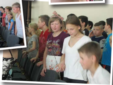
Årets sommarläger samlade ca 90 barn.