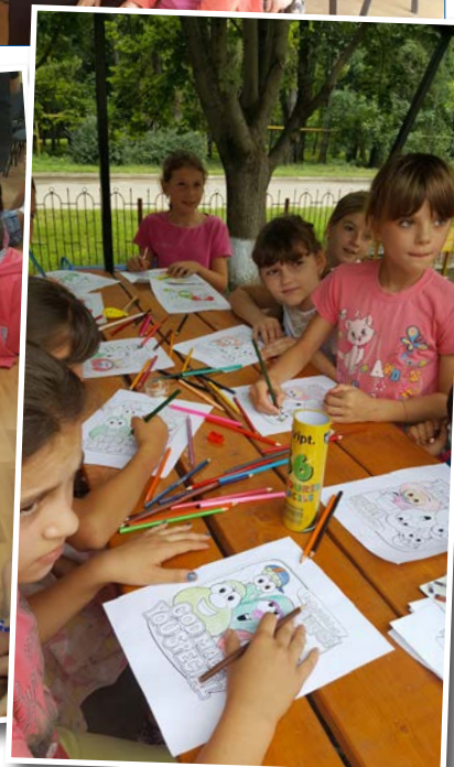
Många barn kom till de olika aktiviteterna.