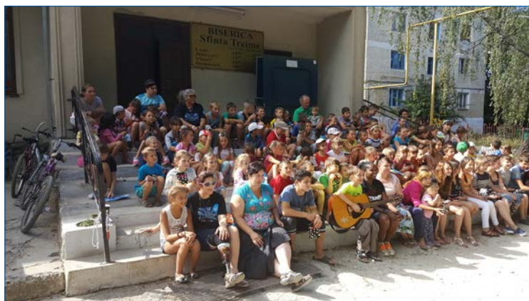
Alla barn som kom på dagkollot samlade på trappen.