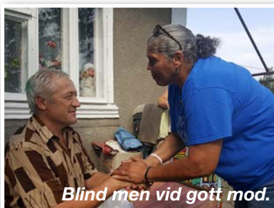
Blind men vid gott mod.