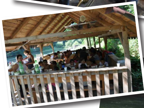
Sommaraktiviteter hos Löttenas Barn.