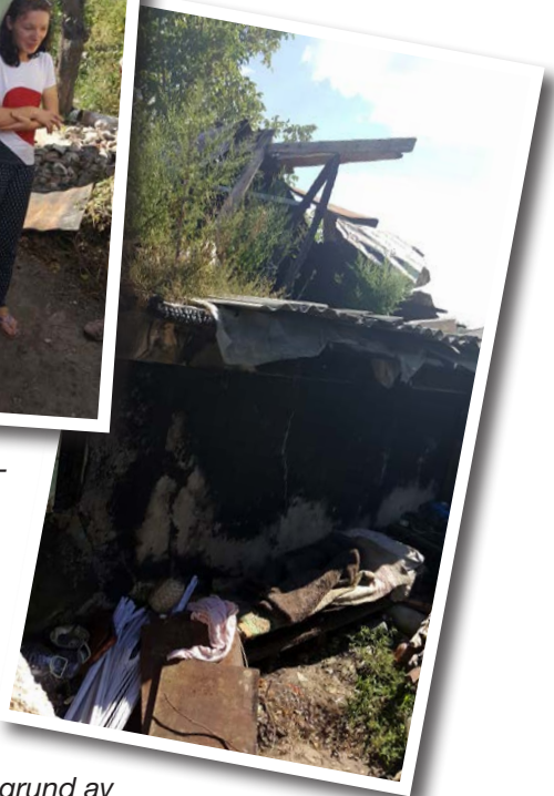
I det starka motljuset är det vårt att urskilja, men här är den del av huset som eldhärjats. Del av taket saknas och man ser resterna av den säng där elden startade på grund av ett omkullvält stearinljus.