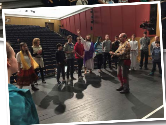
Den stora salen fylls med människor som vill se dramat. Gruppen samlas till lovsång och förbön före kvällens uppsättning.