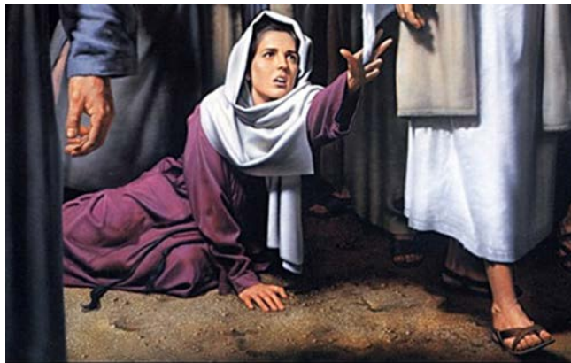
Den blödersjuka kvinnan vi läser om i Markus evangelium.

Bekännelsen är så betydelsefull och viktig. Ordens makt och hur vi närmar oss livets svårigheter med utgångspunkt från den tro som blivit vår är inte betydelselös. Hur vi agerar, vad vi säger, tror jag har en stor och avgörande betydelse. Det är stor skillnad i att tala otro än det är att [i tro] uttala trons ord. Låt mig få ta ett exempel från Bibelns ord. I Mark 5 möter vi kvinnan med blödersjuka. Kvinnan hade varit sjuk i 12 år. Hon hade under dessa år lidit mycket och hennes hälsa hade försämrats. Under dessa år hade hon besökt många läkare för att finna bot för sin sjukdom. De många läkarbesöken hade också gjort henne utblottad. Nu hade kvinnan hört att Jesus skulle besöka staden där hon bodde. Hon grep tag i detta sista halmstrå. Hon befann sig i folkhopen och närmade sig Jesus bakifrån. Med orden: "Om jag bara får röra hörntofsen på hans mantel, så skall jag bli frisk" . I den engelskspråkiga Bibeln står det att kvinnan "sa", dessa ord. Detta har i den svenska Bibeln ibland översatts till "tänkte". Personligen tycker jag bättre om den engelskspråkiga tolkningen, eftersom det får en helt annan innebörd. Även om vi inte kan veta, därför att bibelordet inte