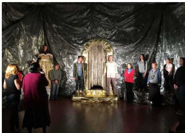
Förberedelser och repetitioner inför uppförandet av det drama som förvandlat livet för många som sett det.

Vi har fått ta emot flera hälsningar från vännerna i Tjeckien efter att vi kom hem. Alla vittnar de om behovet av att evangelium predikas. För oss personligen har det inneburit att vi nu på ett ännu tydligare sätt ser behovet av att förkunna evangeliet i detta land. Församlingarna där kämpar mot ateism och det är vanligt att människor inte alls vet vem Jesus Kristus är. Stora kristna helgdagar firas utan att tänka på vad de egentligen innebär. Vi såg också att många kristna är ljumma i sin tro. De behöver väckas ur sin törnrosasömn för att på nytt börja predika evangeliet med kraft, övertygelse och styrka som pekar på behovet av omvändelse. Bed med oss att Gud öppnar vägar för oss att kunna betjäna detta land med evangelium. Vi hoppas kunna återvända i november och fortsätta detta viktiga arbete, men då till en annan plats och en annan församling.