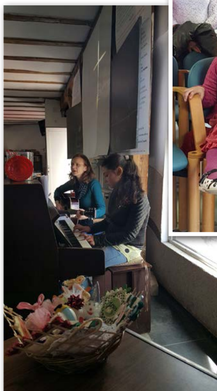
Barn i skiftande åldrar deltar i vksamheten. Här pågår musiktävlingen X-Faktor.