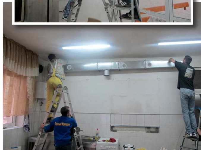
Ny ventilation. Ett första steg är nu taget för att uppfylla de EU-krafter som ställs. Nästa steg är att se över elsystemet.

sliten, varför vi inte såg någon annan utväg än att byta ut den till en nyare och kraftigare dito. Vi hoppas och beder att detta skall vara löst inom några dagar. Detta och min resa är också anledningen till att du fått detta brev någon eller ett par dagar senare än vanligt. Med dessa ord önskar vi er alla det bästa som vi kan erbjuda; Guds rika välsignelse. På återhörande om en månad.