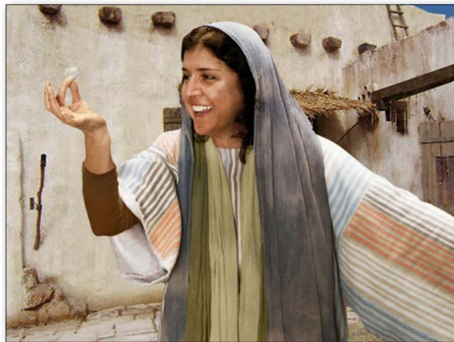
Berättelsen om kvinnan och det förlorade myntet visar på vikten av att söka det förlorade.