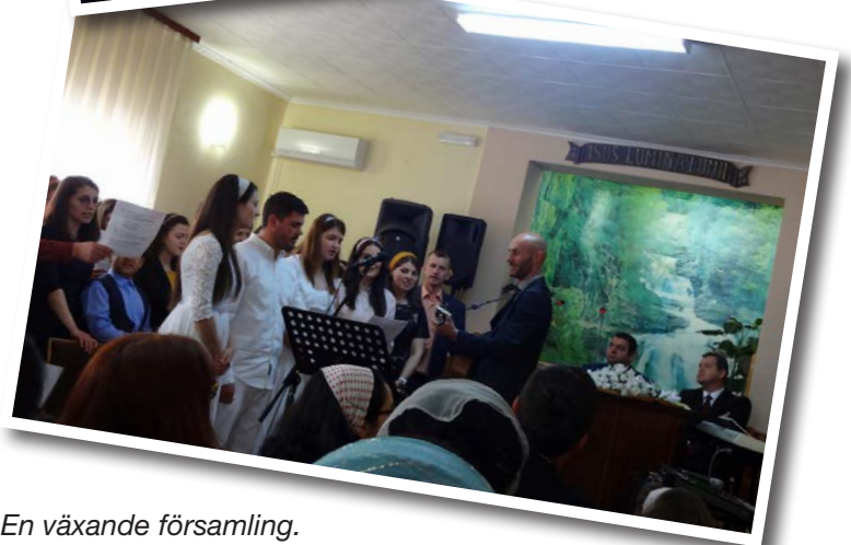
En växande församling. Gädjande att få se när unga människor väljer att följa Jesu exempel och låta döpa sig i vatten.