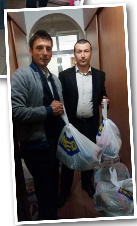
Påsken firades med gudstjänst och utdelning av matpaket.