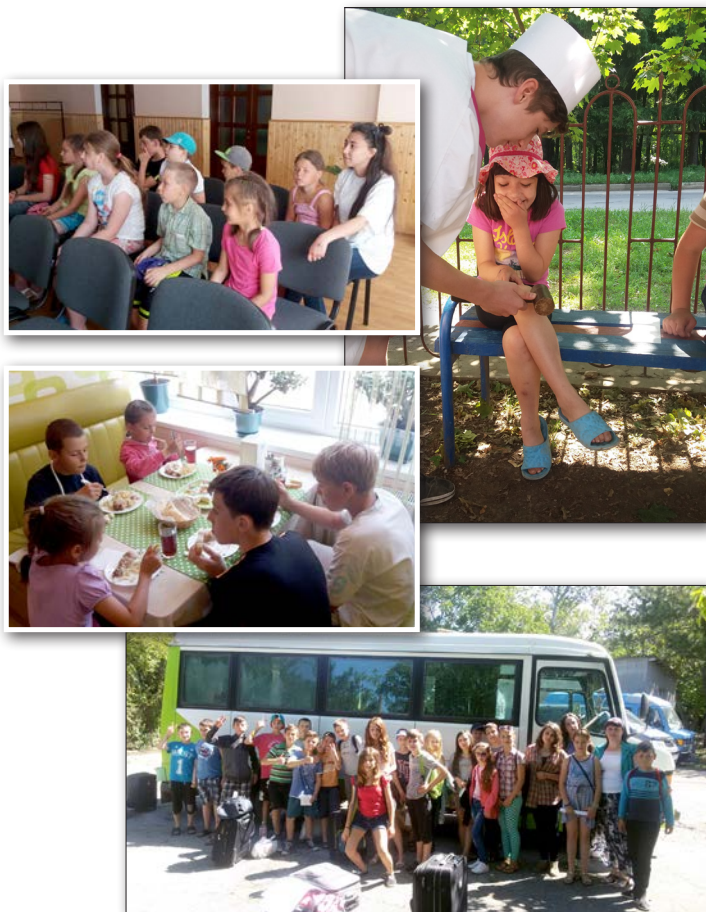
Många barn och unga berörs av sommarens läger.

För många barn i Moldavien innebär sommaren många frestelser, men också många utmaningar, då skola och normala rutiner sätts ur spel. Många driver omkring i samhället, utan något speciellt att göra. Detta faktum utnyttjas också av människor vars avsikter är allt annat än goda. Barn riskerar bli enkla byten för dem som önskar exploatera de unga. Moldavien och områdena omkring har under många år varit föremål för den prostitution och trafficking som finns i övriga Europa. I många av bordellerna