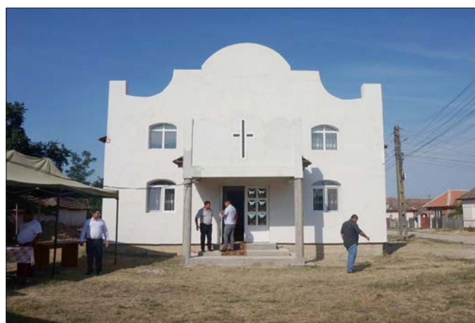
Kyrkan i batar har fått en fin vit fasad.