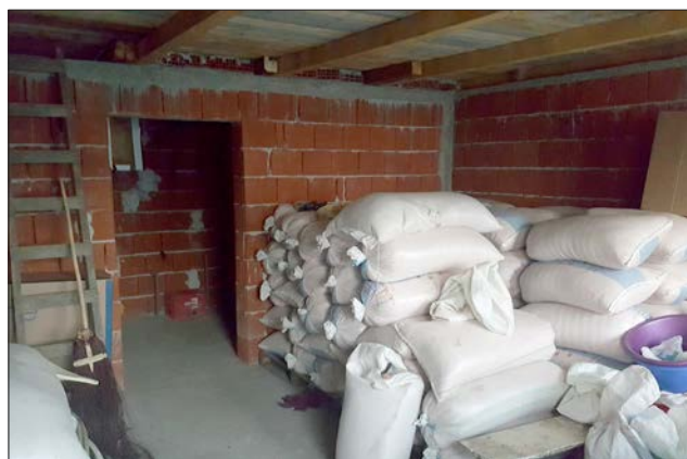
Tillbyggnaden består av ett nytt vardagsrum och den det som skall bli det handikappanpassade badrummet.