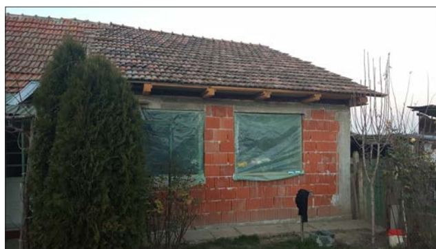
Tillbyggnaden från utsidan.