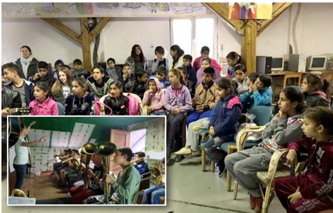
Några av de barn som kommer till Löftenas Barn. Här övar man inför julens olika evenemang.

Vi kommer också få besök av en grupp studenter som studerar medicin. De kommer hjälpa oss med förberedelserna inför julen, då vi kommer ha en julshow. Julen här hos oss kommer redan den 6 december, då vi kommer dela ut julklappar till barnen. För några söndagar sedan hade vi dopförrättning då två av de barn som gått hos oss lät döpa sig. De hade beslutat sig för att följa Jesus och bli en del av vår församling här i Cheri. Det var en välsignelse från Herren och en uppmuntran för våra anställda att se frukten av deras mångåriga arbete. Vi är vissa om att fler kommer efter dem som nu döpts.