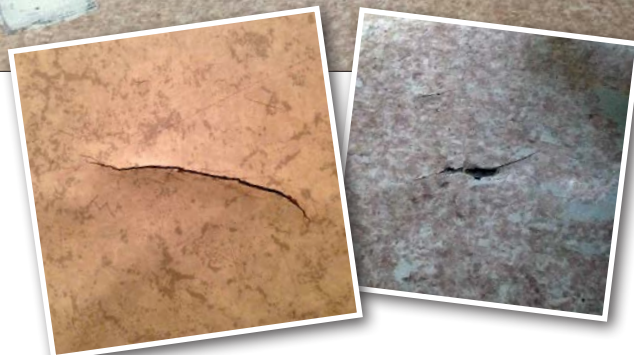
Golven är i mycket dåligt skick efter 25 års slitage.