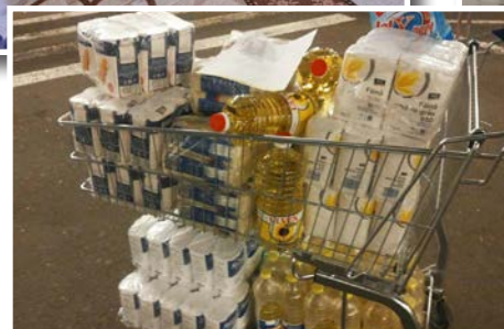
Potatis, briketter, medicin och övriga matvaror.