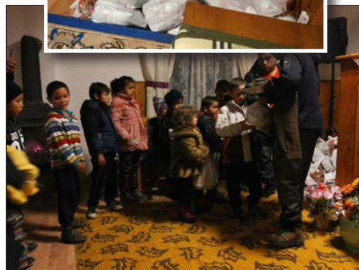
Utdelning av matpaket och andra artiklar skedde i församlingens lokaler i Tinca. Men hembesök gjordes också till de som var sjuka.