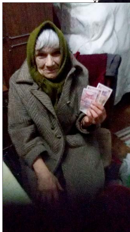
De pengar som givits till dessa båda kvinnor kommer att gå till mediciner. Något som det inte alltid finns pengar över för att köpa då pensionen är låg och det mesta därför går åt till att köpa mat och betala räkningar.