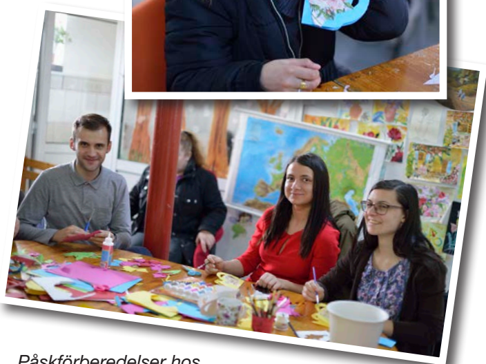
Påskförberedelser hos Löftenas Barn