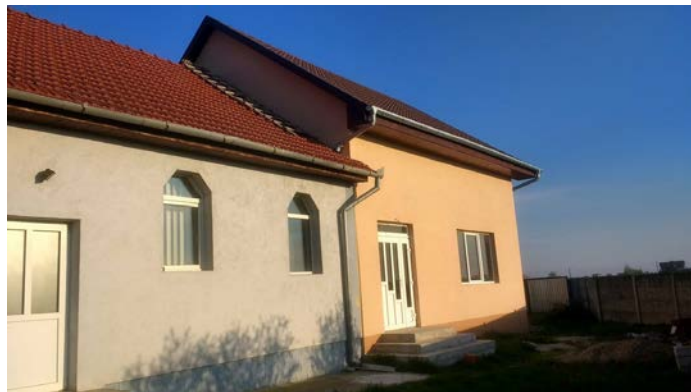
Tillbygget sett från utsidan. En behaglig aprikos färg pryder nu fasaden.

Vetskapen om att det finns ett tydligt utstakat mål med varför man vill bygga till sina lokaler har skapat en framtidstro för medlemmarna. Man vi se människor komma till tro, men