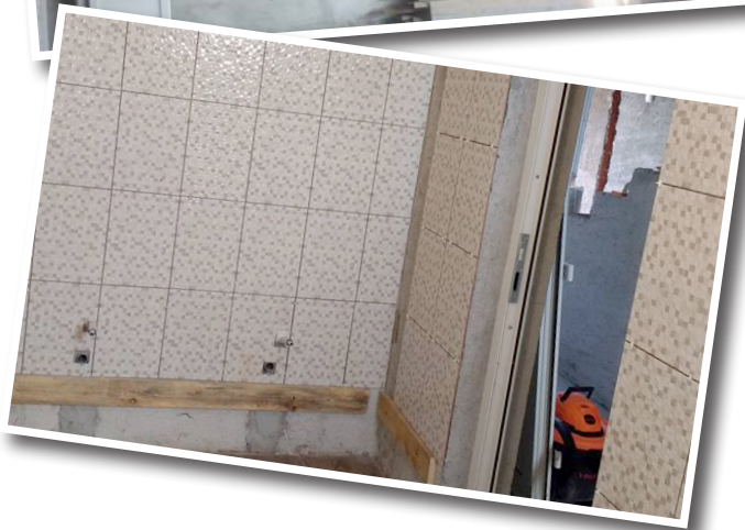
Möteslokalen på ovanvåningen som behöver färdigställas. Badrummen gjordes i september förra året.